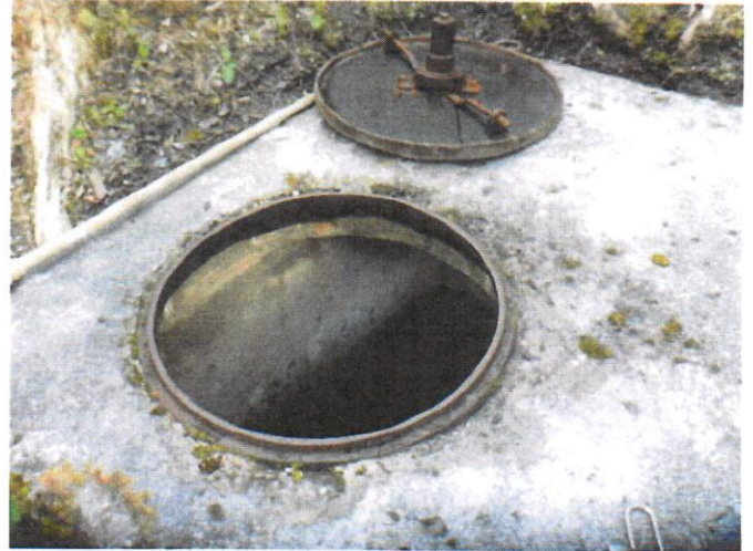
5: Brunnenstube Chessi 3 (Massnahmen nicht umgesetzt)