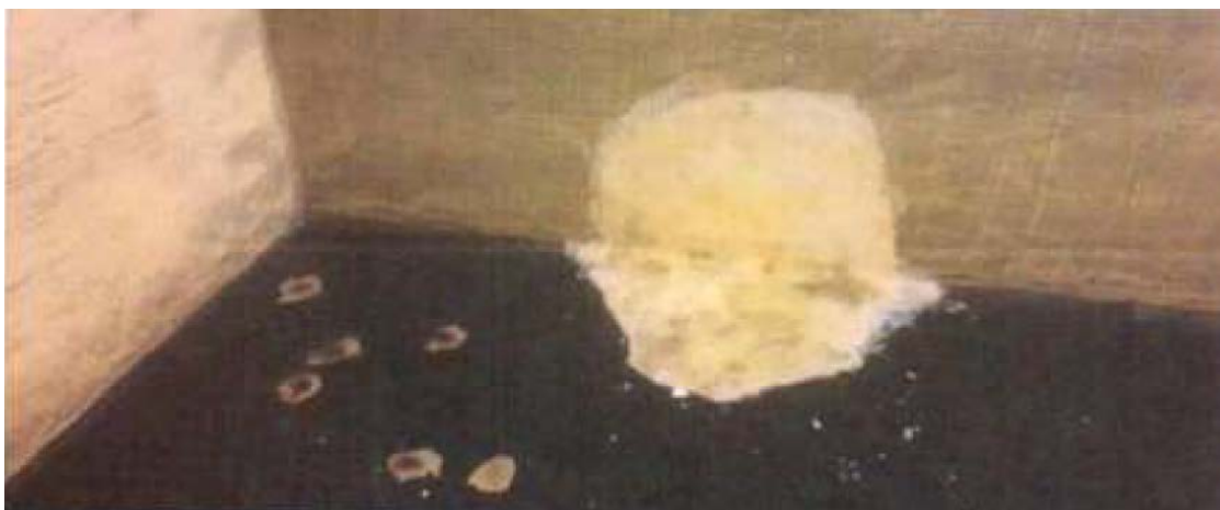
Zustand vom Boden in der Trinkwasserkammer "Teufelsfriedhof"

Die Hauptleitungen vom Reservoir «Bovel» bis zur Vialstrasse wurden im Jahr 1972 erneuert, und wurde, abgesehen von Leitungsumlegungen, seither nie saniert. Es sind schon Leitungsbrüche aufgetreten, was bei dieser wichtigen Hauptleitung nicht sein darf.