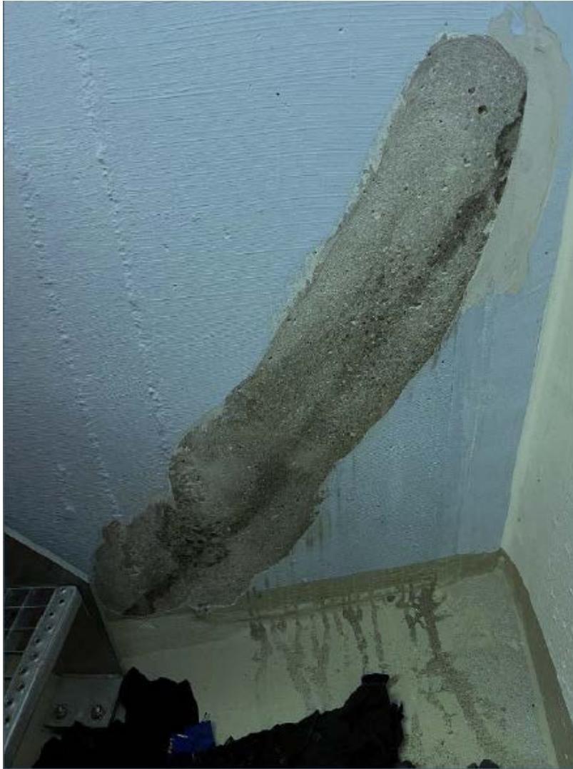
Reparatur Riss Wasserkammer "Bovel"

Der Gemeindevorstand hat sich nach eingehendem Studium des Berichtes und Empfehlung von den Fachleuten für die Ausarbeitung eines Projekts gemäss «Variante E» entschieden. Der technische Bericht mit Variantenstudium kann auf der Homepage der Gemeinde oder auf der Gemeindeverwaltung eingesehen werden.