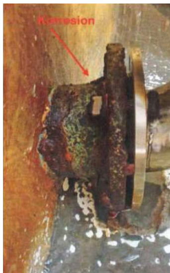
Zustand der Rohre in der Trinkwasserkammer "Teufelsfriedhof"

Das Reservoir «Teufelsfriedhof» wurde 1899 erbaut und besteht aus zwei Kammern mit je 100 m 3 Brauchwasserinhalt. Im Jahr 1922 wurde das Reservoir mit einer Brauchwasserkammer von 200 m 3 erweitert. Das Reservoir «Bovel» besteht aus einer Kammer mit 500 m 3 Inhalt. Es wurde im Jahr 1979 rund 60 Höhenmeter oberhalb des Reservoir Teufelsfriedhof mit 300 m 3 Brauchwasser und 200 m 3 Löschwasserreserve erbaut. Dadurch wird das Reservoir «Teufelsfriedhof» seitdem auch als Stufenpumpwerk genutzt, womit das Wasser auch zum Reservoir «Bovel» gepumpt werden kann. Ebenfalls sind die beiden Stufenpumpen aus den 80er Jahren sanierungsbedürftig und müssen ersetzt werden. Sie haben seit längerem wiederholt Störungen verursacht. Seit 45 Jahren wurden die Speicherkapazitäten trotz Bevölkerungs- und Industriewachstum nicht erweitert.