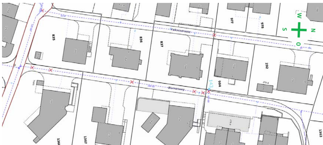
Rote Kreuze = Rohrbrüche

Die ebenfalls parallel verlaufende Abwasserleitung im Blumenweg wurde mittels Kamera-Aufnahme untersucht. Diese weist an zwei Stellen kleine Schäden auf, welche aber repariert werden können.